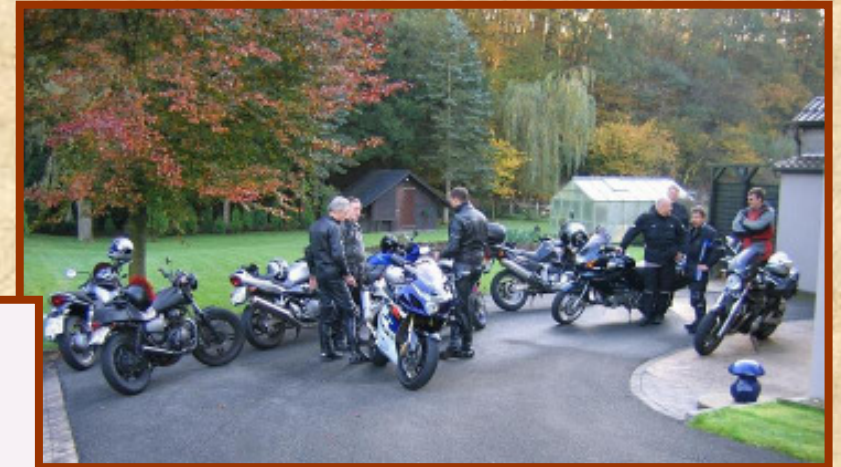
Treff bei Michel

Treffen bei Michel, 9 Humanabiker und Friends finden sich ein. Es ist schon Spätherbst, aber es soll ein schöner Tag werden. Abfahrt > und Michel hinterher. Es geht über's Wiehengebirge und dann auf kleinen Strassen an Rahden vorbei immer Nordwärts in die Gemeinde Preußisch Ströhen zum Nordpunkt von NRW.