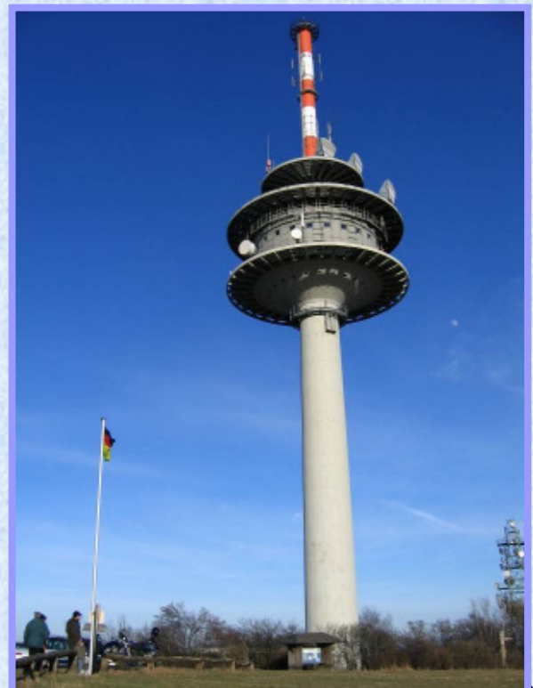
Sendeturm auf dem Koterberg

Es geht in kleinen und groen Bogen mehr oder weniger direkt zurck nach Hause. Es ist alles in Ordnung im Revier,  alle Kurven sind noch da.