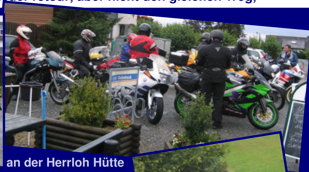
an der Herrloh Hütte

wir machen auf geteerten Strassen einen Bogen und finden dann auch, nach ein wenig suchen, die andere Gaststätte mit den Kollegen.