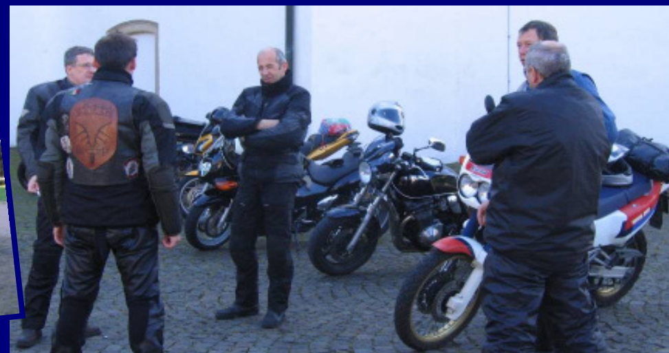
Pause im Schatten der Fürstenberger Kirche